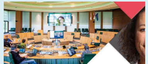
Handreiking 'Vergaderen in de anderhalvemetersamenleving'