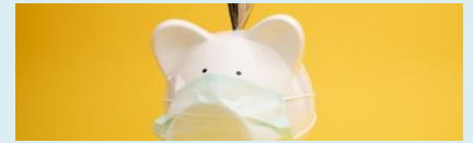
Het lastige pad na corona