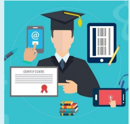
Certificaat voor het raadswerk?