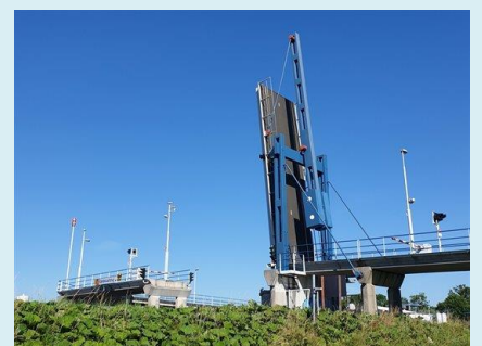
Herstelwerkzaamheden aan Kandelaarbrug