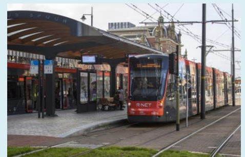
Concept Vervoerplannen 2021 naar gemeenten