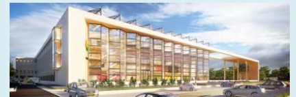
Jaarevent Greenport West-Holland