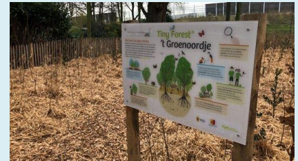
Eerste Tiny Forest van Zuid-Holland