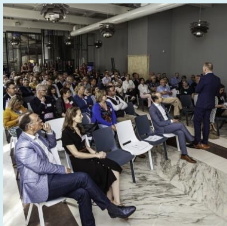
Dag voor de Raad 2019