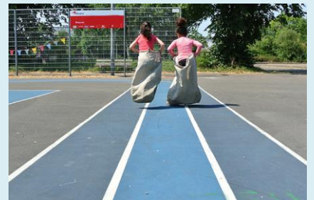
Stichting Move actief in Delft