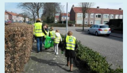
Gemeenten staan achter uitbreiding statiegeld