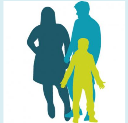
Inzicht in de jeugdzorg