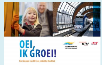
Vraag naar OV neemt toe