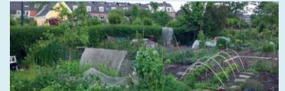
Excursie Innovatieve Stadslandbouw