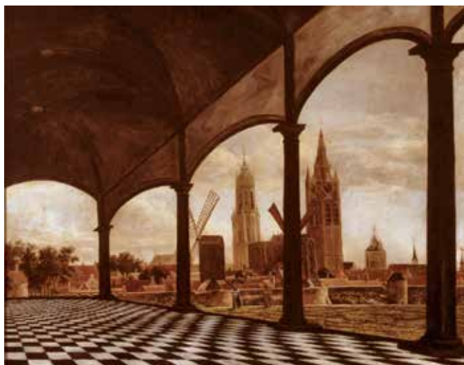
Gezicht op Delft vanuit een fantasie loggia | 1663 Daniël Vosmaer (1622-circa 1666) olieverf op doek Collectie Museum Prinsenhof Delft Bruikleen Rijksdienst voor het Cultureel Erfgoed | B 1-36